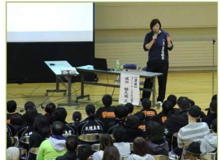
＜清田区スポーツ講演会＞ ※講演の後は実技指導も！