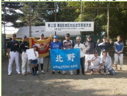
＜第22回壮年野球大会＞ ※今年度は大雨で中止に…