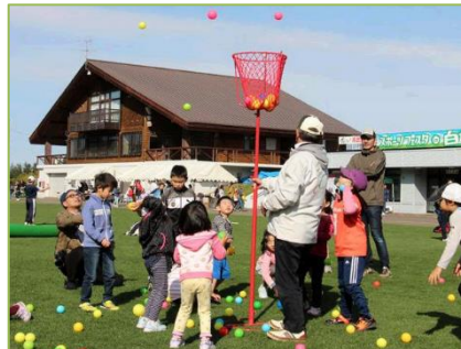
＜スポーツフェスタ in 白旗山＞ ※参加者は3,000人！