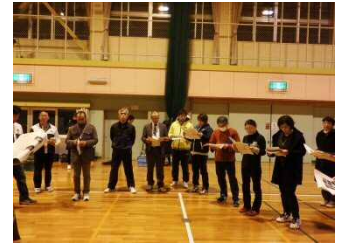
審判講習会も行いました