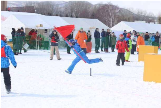
フラッグ奪取で勝利の瞬間！

小学生低学年の部・高学年の部・一般の部と3つにクラス分けをして、今年は27チーム・265名で行われ、参加チームの家族の熱い応援を受け、熱戦を繰り広げました。