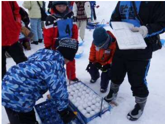
一生懸命雪球作り